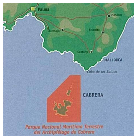
Localització de Palma i Cabrera